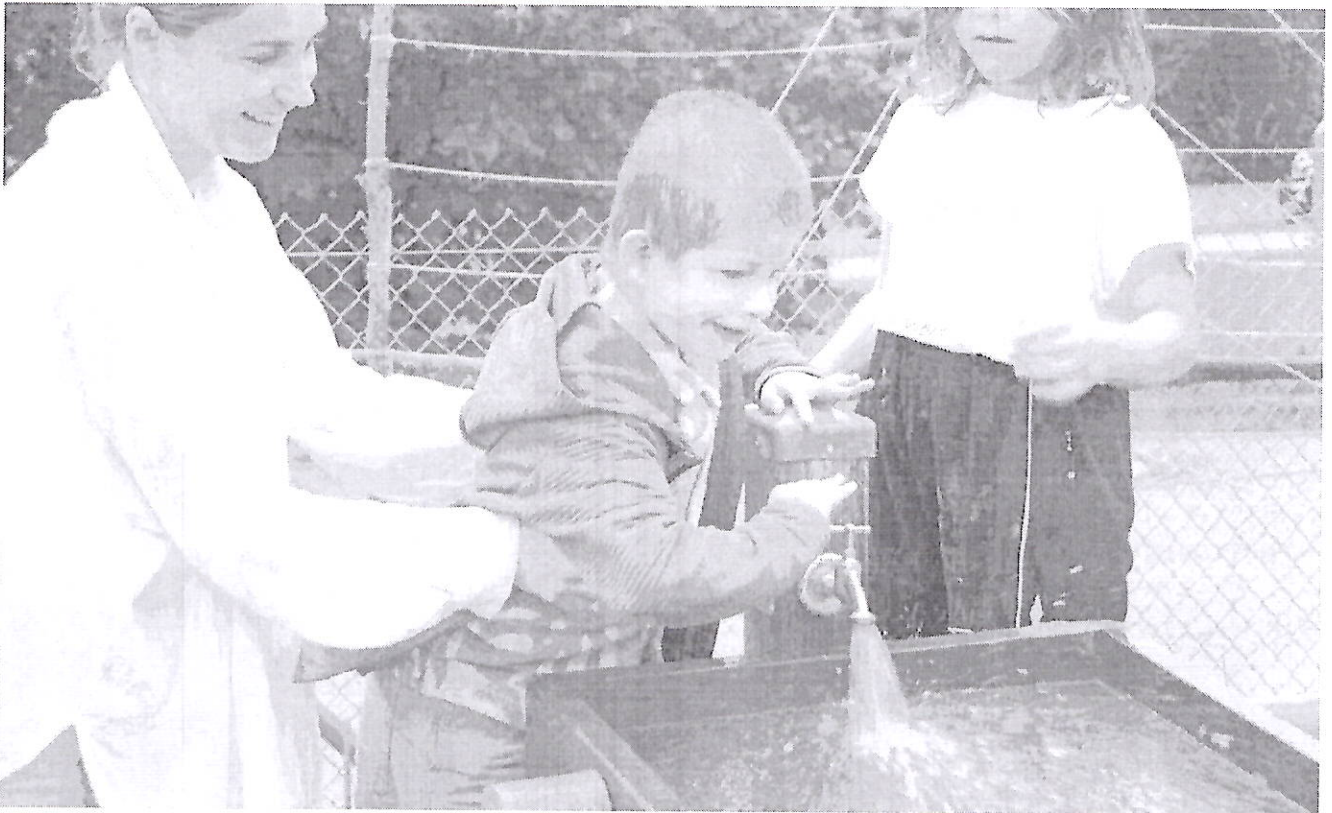
Neben den diversen Programmpunkten kam bei der integrativen Ferienfreizeit in Mariaberg auch das freie Spielen nicht zu kurz.

In der zweiten Woche war das Oberthema „Rund um den Pfeifenputzer“: Dabei wurden Figuren, Brillen, Haarreifen und Schlüsselanhänger aus Pfeifenputzern gebastelt, es gab einen Ausflug zur Bachritterburg nach Kanzach und das Sigmaringer Kasperletheater stand auf dem Programm. Zudem haben die Kinder in beiden Wochen Pizza gebacken und das Hallenbad besucht.