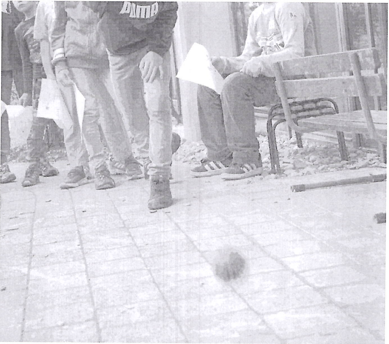
Gemeinsam spielen und sich begegnen – ohne Vorurteile – ist das Credo der Mariaberger Ferienfreizeit.

Betreut wurden die Kinder von vier bis fünf Fach- und Nichtfachkräften im Team. Kinder mit und ohne Behinderungen sollen sich begegnen können, Vorurteile sollen gar nicht erst aufkommen, gemeinsam sollen die Kinder eine tolle Sommerzeit genießen, Spaß haben und zusammen Ausflüge machen.